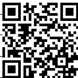
EU Declaration of Conformity